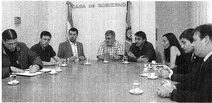
PÚBLICO Y PRIVADO. LOS FUNCIONARIOS PROVINCIALES Y LOS DIRECTIVOS DE LAS CADENAS, AYER EN CASA DE GOBIERNO.

La funcionaria subrayó que los productos de la canasta de fin de año se podrán adquirir a "un precio razonable que son 70 pesos, lo cual indica una variación del 15 por ciento aproximadamente en relación con el año pasado". Por último expresó su agradecimiento a los empresarios "por la colaboración y predisposición que este año han renovado".#