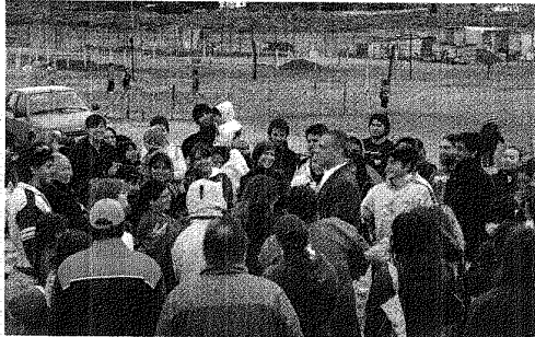
El intendente se reunió con los adjudicatarios de las fracciones 14 y 15.

“Acceder al lote es un primer paso, pero es un paso trascendente”, expresó el intendente de Comodoro Rivadavia, Martín Buzzi, al término de la reunión con los referentes de 30 manzanas en