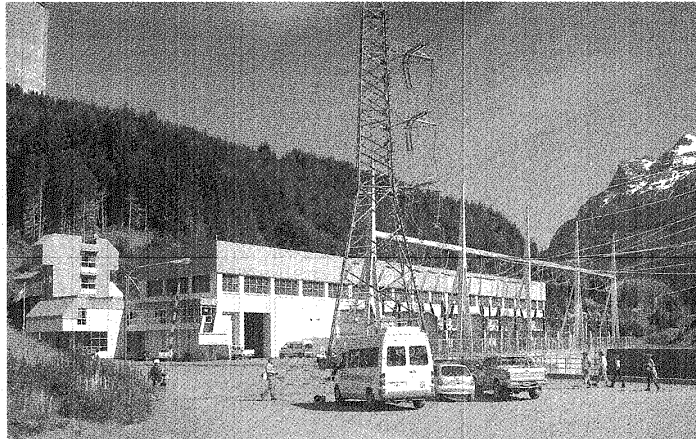
SE REPARTE. FINALMENTE, LA PROVINCIA SE QUEDARÁ CON LO QUE LE PERTENECE DE HIDROELÉCTRICA FUTALEUFÚ.

La empresa opera en el Mercado Eléctrico Mayorista y comercializa más del 90% de su producción a la empresa Aluar, mientras que el resto