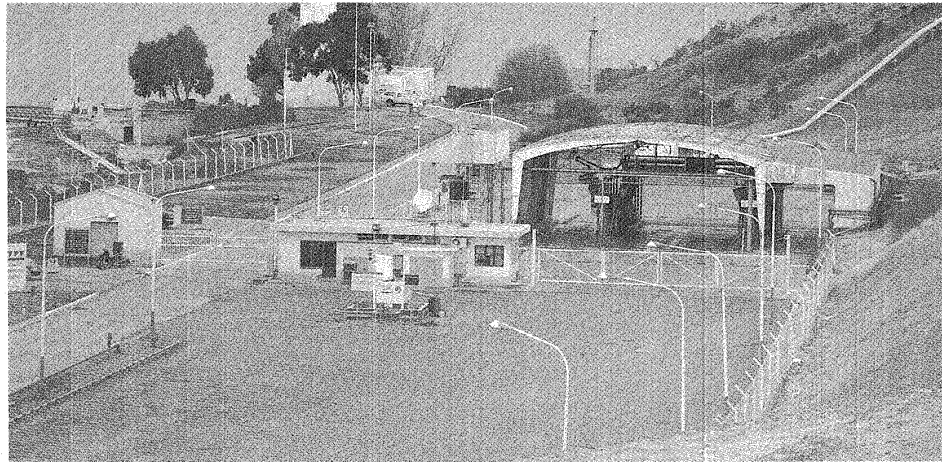
NADIE. LOS ESCENARIOS PETROLEROS QUE SUELEN ESTAR POBLADOS DE TRABAJADORES, ESTÁN DESIERTOS DESDE HACE YA DOS SEMANAS, SIN UNA SOLUCIÓN APARENTE.

Es porque las piletas donde se almacena el crudo ya están completas. Chubut y Santa Cruz ya pierden entre 3 y 6 millones de dólares por día. Si el reclamo gremial no se resuelve este fin de semana, comenzará el desabastecimiento.