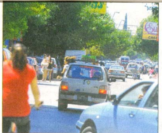
El centro roquense no tuvo calma en la mañana de ayer. Todos a comprar.

En las veredas, los vendedores ambulantes de muy variados productos –flores, frutas, juguetes, accesorios y hasta cestos– también se mostraron muy contentos por las ventas.