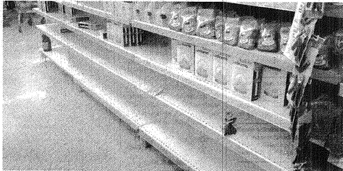
LUEGO DE JULIO EL PRODUCTO VOLVIÓ A SUBIR CON EL MISMO IMPULSO, Y EN CONSECUENCIA APARECEN NUEVAS MARCAS.

Lo que ocurre en estos días en la ciudad de Trelew, y como se hacía mención en líneas anteriores, no está lejano a la realidad que se vive desde hace algunas semanas en el resto del país, donde también se sufre desabastecimiento y suba de precios. Uno de los medios gráficos de Buenos Aires señalaba que "en la mayoría de los supermercados de Capital Federal