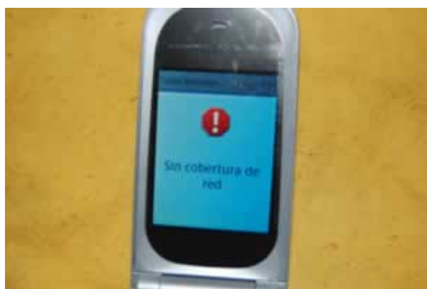
Lacónico el mensaje que indicaba la pantalla.