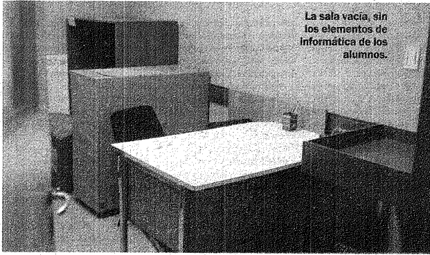
La sala vacía, sin los elementos de informática de los alumnos.

por la madrugada, que ingresaron por la puerta principal de entrada", aclaró la docente.