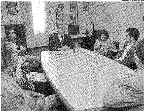
SE REALIZÓ EN EL MUNICIPIO LA ENTREGA DE LAS RESOLUCIONES DE RESERVA DE TIERRAS.