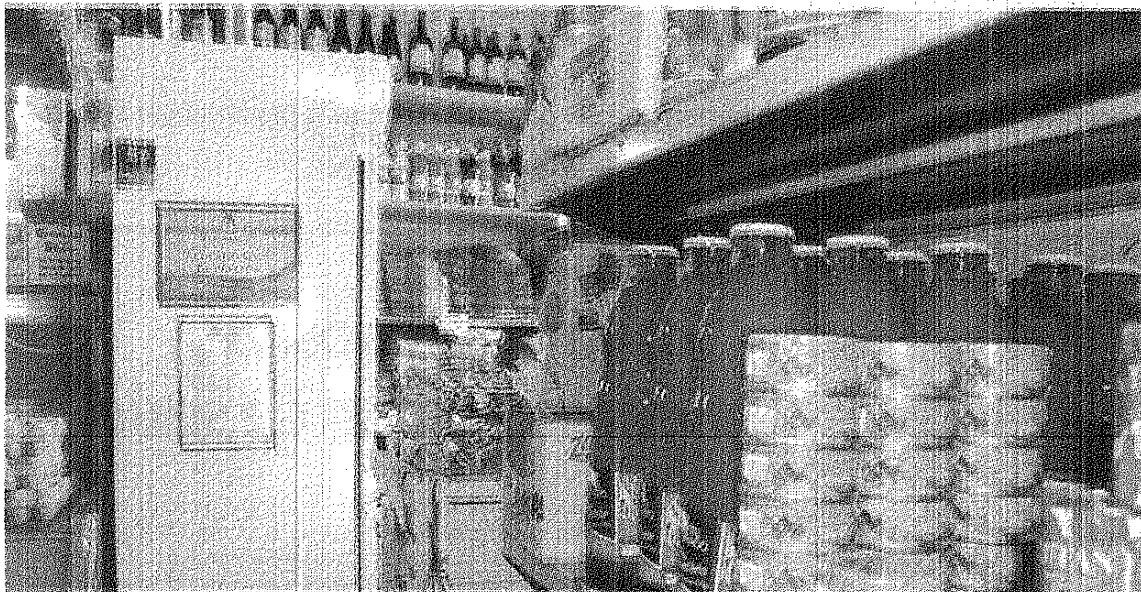
MUY BUEN BALANCE. EL CARTEL INDICADOR DEL ACUERDO SOCIAL DE PRECIOS ATRAJO CLIENTES.