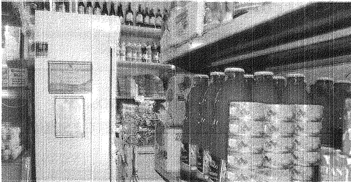
MUY BUEN BALANCE. EL CARTEL INDICADOR DEL ACUERDO SOCIAL DE PRECIOS ATRAJO CLIENTES.