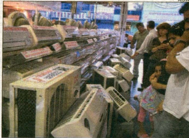
Electrodomésticos, uno de los rubros de mayores ventas.