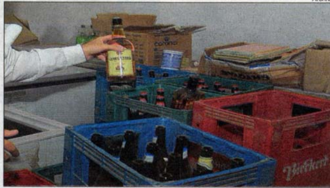
Hubo secuestros en locales y en la calle. Confiscaron 5.000 litros de bebidas alcohólicas.