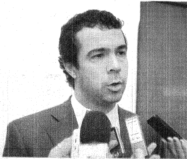
Ministro Korn: "no sé por qué tanta desesperación".

Pablo Korn dijo ayer que el Gobierno pretende debatir el tema minero recién después de las elecciones del 20 de marzo, mientras el vicegovernador Mario Vargas también afirmó que el debate actual es apresurado. Así buscan aplacar las críticas que desde diferentes sectores se refieren a la existencia de acuerdos del gobierno con empresarios del sector.