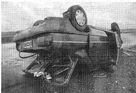
Los ocupantes del vehículo que volcó en la zona de Tres Cerros sufrieron lesiones de diversa consideración.

especial cuidado por la gran cantidad de fauna lindante en las calzadas, específicamente por la presencia de guanacos".