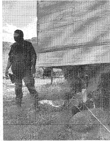
El artefacto explosivo en toda su dimensión.

ron a los vecinos del lugar quienes informaron que el artefacto estaba en el predio desde hace más de 30 años, como antes se señaló.