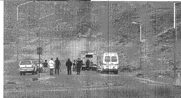
El operativo de seguridad incluyó la interrupción del tránsito por el camino del Centenario.

Debajo de una casilla de las que utilizan las empresas en campamentos, se encontraba el antiguo aparato que por sus características pertenecería a la Armada, según informó el jefe de GEOP. Incluso