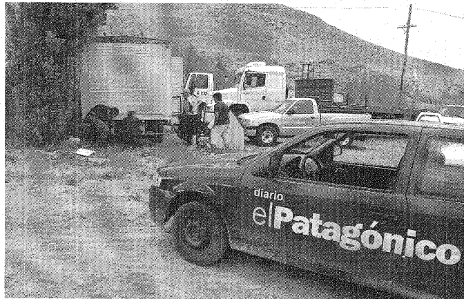
Diario Patagónico muestra a la policía la zona donde se hallaba el artefacto.

Contiene alrededor de 80 kilos de carga explosiva y estaba en una zona ubicada detrás de la estación de servicio Eureka. La Justicia Federal estableció una investigación para determinar quién lo abandonó en el lugar. En forma paralela, con la presencia del GEOP, se montó desde la tarde de ayer un amplio operativo. Se acordó el sector y se cortó el tránsito por el camino del Centenario. También estuvo interrumpida temporalmente la circulación por la ruta nacional 3. Al cierre de esta edición, con la llegada de especialistas del Ejército, Gendarmería y Prefectura se evaluaba la posibilidad de trasladarlo a un sector más seguro, lo que se dificultaba por sus grandes dimensiones para manipularlo.