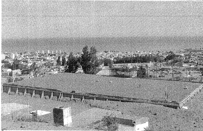
EL AGUA, TESORO PRECIADO. EL AUMENTO DE LA DEMANDA DENUNCIA LA NECESIDAD DE INVERTIR EN OBRAS.