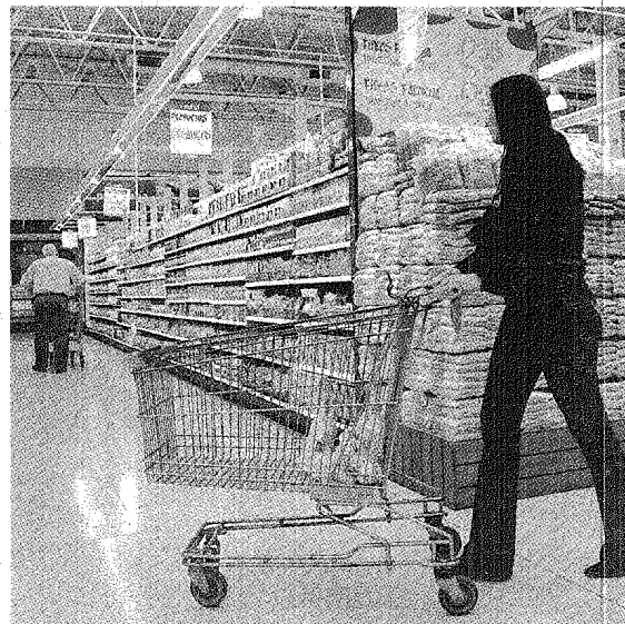
A LA HORA DE COMPRAR, LA VERDADERA INFLACIÓN SE NOTA EN EL CHANGUITO.

Los que menos subieron fueron los de Bienes y Servicios (0,3), Educación (0,5), Alimentos y bebidas (0,6), Transporte y Comunicaciones (0,6), y Equipamiento y mantenimiento del hogar (0,7). Por otra parte, los precios mayoristas aumentaron apenas 0,9 por ciento en di-