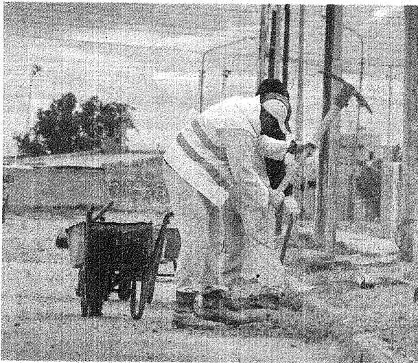
Personal operativo realiza tareas de desmalezamiento y retiro de escombros, en diversos sectores de Pico Truncado.

Con el fin de generar conciencia ambiental entre los vecinos, en cada uno de los sectores acondicionados también se colocarán carteles con la leyenda “prohibido terminantemente tirar basura en este parque”.