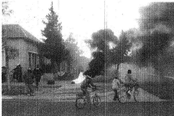
Los manifestantes mantienen la toma del edificio municipal de Las Heras, con quema de cubiertas. Hasta ayer no había orden judicial de desalojo. (Foto: Semanario El Preámbulo).