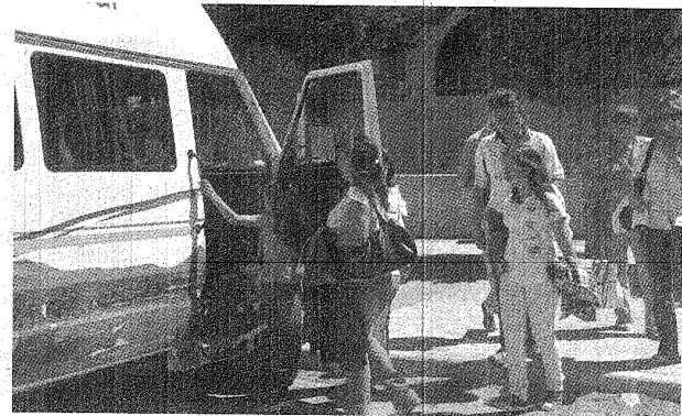
El lunes arrancó la nueva edición de "Turistas por un día" en Comodoro.