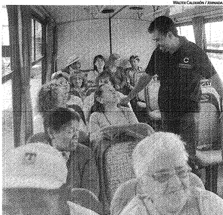
COMENZO UNA NUEVA TEMPORADA INCLUYENDO CIRCUITOS Y PROPUESTAS RENOVADAS.