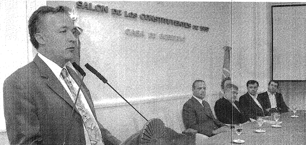
PERFIL GARCÍA MORENO RECHAZÓ LA OFERTA LABORAL DE ELICHECHE Y YA SE VE TRABAJANDO MUY CERCA DE LA CASA ROSADA, JUNTO CON DAS NEVES Y EN 2012.

El gobierno ejecutará 1.246 viviendas, además de varios mejoramientos barriales. Comenzará a construirse este año para inaugurarse en 2012. Para el gobernador Das Neves, el plan es posible "gracias al equilibrio fiscal y la austeridad".