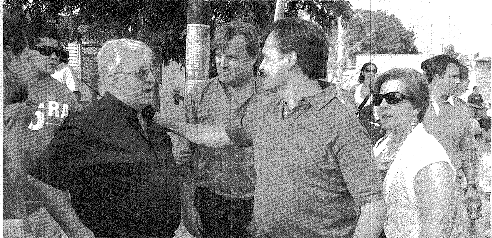
CARA A CARA. ESTA SEMANA ALGUNOS CANDIDATOS SE ENCONTRARON DE CASUALIDAD EN TRELEW. AHORA TENDRÁN LA OPORTUNIDAD DE EXPONER SUS IDEAS.