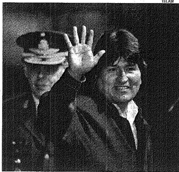
■ Evo Morales: cinco años en el poder y un momento difícil.

"Bolivia no sólo es una esperanza para los bolivianos, sino ahora Bolivia es la voz de los pueblos del mundo", acotó al defender causas mundiales, como la lucha