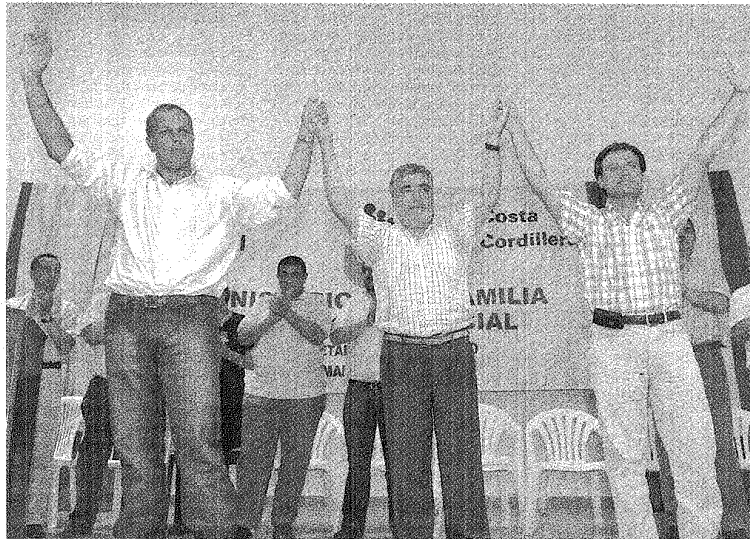
GANADORES. LOS CANDIDATOS DEL OFICIALISMO, JUNTO AL GOBERNADOR, AYER EN EL LANZAMIENTO DEL PROGRAMA.

Fue en Las Golondrinas, donde encabezó la apertura de un programa de turismo social para adultos. Se anunció que el 15 de junio, Día de la Toma de Conciencia del Maltrato a los Adultos Mayores, estará en la currícula escolar.