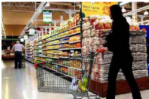
Los mercantiles buscarán una mejora salarial de entre el 30 y 35 %.

El presidente de la Confederación Argentina de la Mediana Empresa (CAME), Osvaldo Cornide, rechazó ayer un aumento salarial para el sector mercantil que se ubique entre el 30 y el 35 por ciento, como pretenden los sindicalistas. El presidente de la Confederación Argentina de la Mediana Empresa, rechazó un aumento salarial para el sector mercantil que se ubique entre el 30 y el 35 por ciento, como pretenden los sindicalistas. «Las pymes