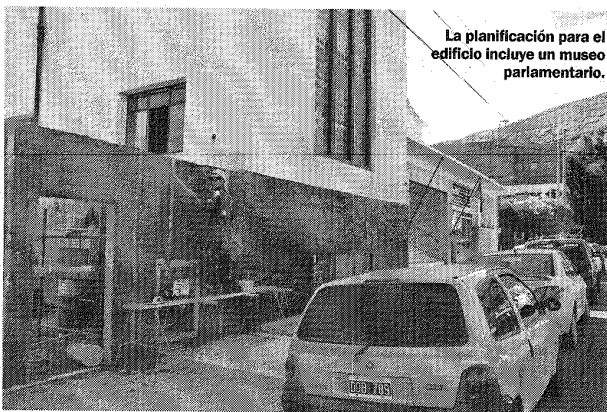
La planificación para el edificio incluye un museo parlamentario.

tenham acceso a la historia del Concejo a través de los elementos hoy guardados sin finalidad.