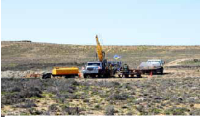
Tránses de exploración en Cerro Moro.

Según la información suministrada por la minera canadiense, "de los 46 pozos perforados, 24 devolvieron resultados significativos". Esperan tener el estudio de prefactibilidad para el mes de abril.