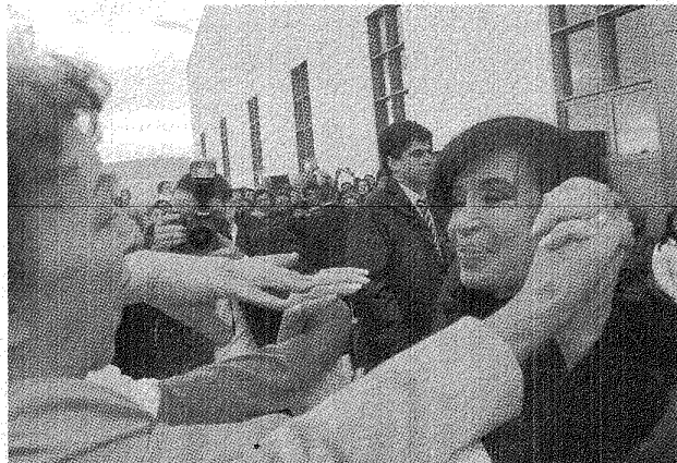
En El Calafate, Cristina Kirchner volvió a recibir múltiples muestras de afecto.

En respuesta a algunas versiones lugareñas, la Presidente fue contundente: “No voy a vender