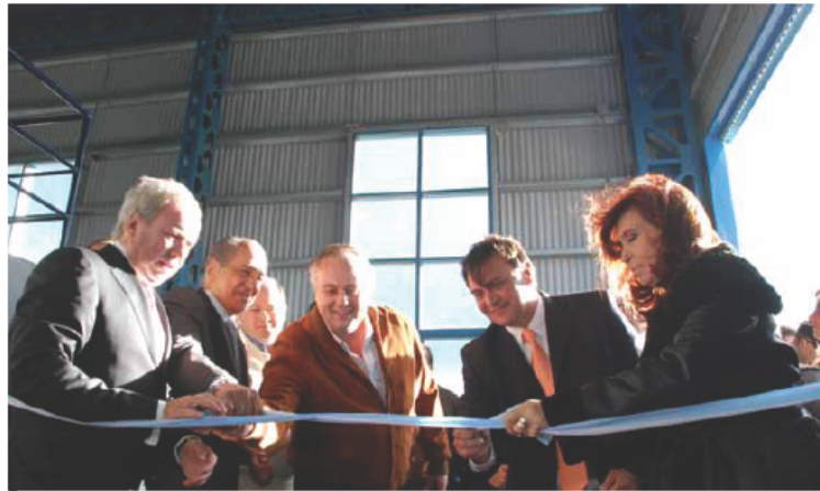
El momento de la inauguración de la Planta de Tratamiento.

En su discurso, la Jefa de Estado dijo que “esta es una obra estratégica que me enorgullece como argentina poder inaugurarla” y añadió “es una obra de una magnitud impresionante, creo que en pocos lugares del mundo se