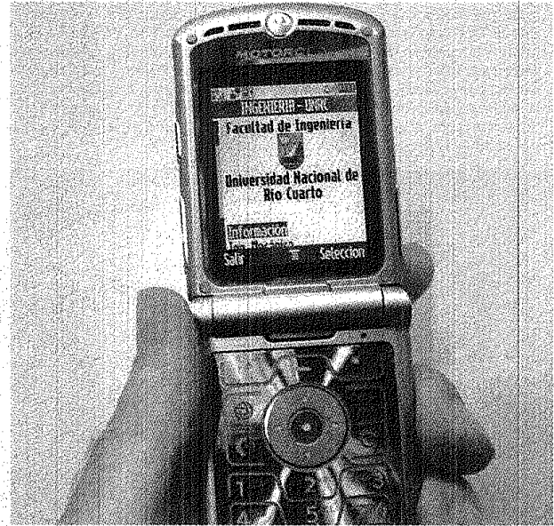
DEFENSA AL CONSUMIDOR ASEGURÓ QUE EL COBRO ES "INDEBIDO".

Asimismo, se les hace saber a los clientes que en caso de encontrarse ante esta práctica o cobro, esta misma puede denunciarse en las oficinas locales o provincial ya que "esta práctica es plausible de ser sancionada", haciendo saber también que "los usuarios tienen el absoluto derecho a negarse a abonar el monto adicional que se les pretenda cobrar. Solicitando al comerciante que sólo se les cobre por el precio real de la carga virtual o el valor que estipula claramente en el anverso de la tarjeta". Los damnificados pueden emitir su denuncia o reclamo ante la oficina de Defensa del Consumidor local, o también pueden hacerlo por la línea gratuita provincial 0800-999-7843.#