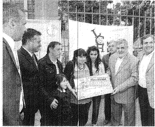
CHEQUE EN MANO. EL GOBERNADOR ENTREGÓ EL PREMIO MAYOR DEL TELEBINGO.

Luego se refirió al anuncio realizado por García Moreno respecto al llamado a licitación para realizar movimiento de suelos para la urbanización de 1200 lotes más: "No es menor incorporar este movimiento de suelos, para que no menos de 14 organizaciones sociales, asociaciones, cooperativas, sindicatos, puedan de manera definitiva avanzar con la urbanización y con la ocupación del lugar en el barrio Ciudadela para 1200 familias", expresó.