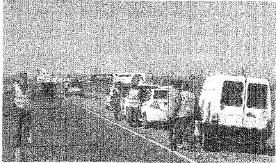
LOS GENDARMES ADEMÁS DEL CONTROL DE LA DOCUMENTACIÓN DARÁN INFORMACIÓN SOBRE EL ESTADO DE RUTAS.

Por tal motivo, desde Gendarmería se explicó cual es la documentación exigida para salir del territorio. Los mayores de edad deberán viajar con su D.N.I (Ver recuadro) y cédula de identidad Mercosur, expedida por la Policía Federal Argentina. En caso de