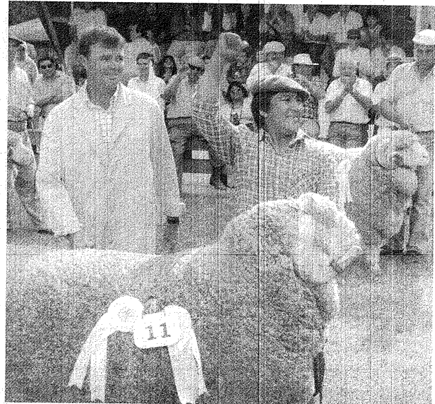
A partir de hoy confluirán diversas emociones en la exposición de la Sociedad Rural de Comodoro Rivadavia.

En total se presentarán unos 112 ovinos de las razas Merino Astado, Polled Merino y Corriedale en las distintas categorías individuales y lotes, candidatos a convertirse en el Gran Campeón de este año. Esta mañana comienza también la actuación del jurado de admisión. Una vez más la actividad contará con la