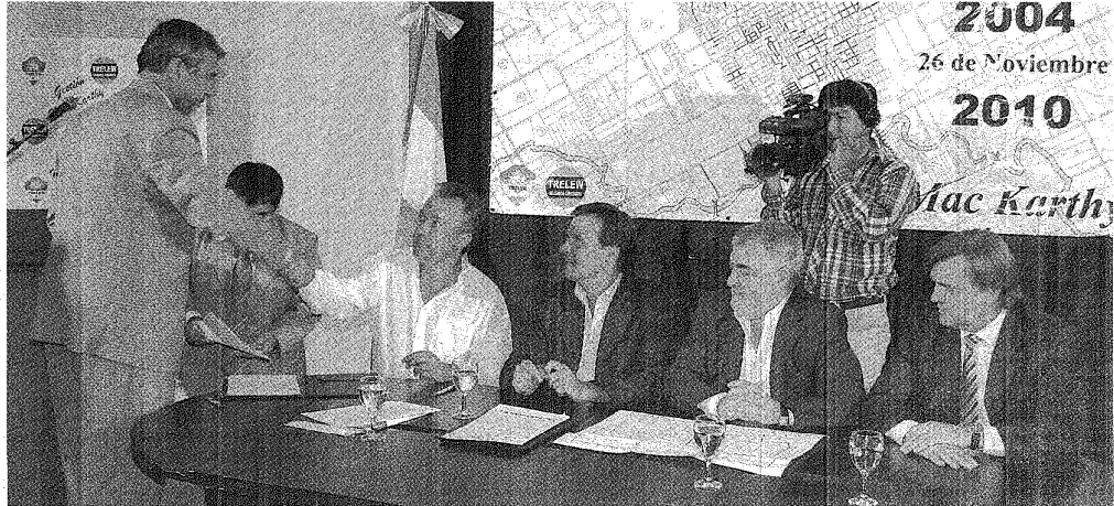
ANUNCIO. ESTA NUEVA PLANTA ESTARÁ UBICADA CERCA DE CORFO, EN EL PARQUE INDUSTRIAL DE TRELEW.

En tal sentido, el intendente recordó que "en algún momento presenta-