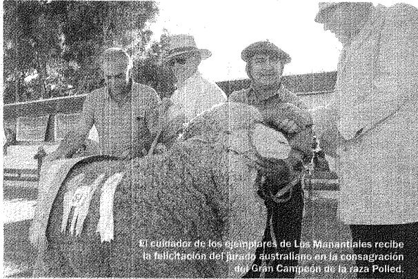
El cuidador de los ejemplares de Los Manantiales recibe la felicitación del jurado australiano en la consagración del Gran Campeón de la raza Polled.