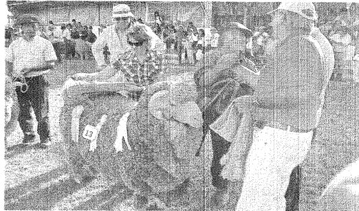
El Gran Campeón es consagrado con todos los honores de la ocasión, ante la algarabía de su cuidador.

en la raza Merino Astado, se trata de un animal que tiene un peso de 148,5 kilos y la finura de su lana que alcanza los 21,8 micrones, un nivel óptimo para trabajar esa materia prima.