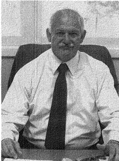
Intendente Britapaja: "se necesita estar en una mejor relación con el gobierno nacional".

Confiado en que una vez más los vecinos de Sarmiento depositarán en las urnas una contundente cuota de confianza por su capacidad de gestión y su forma de hacer política, el candidato a la intendencia por sexta vez consecutiva,