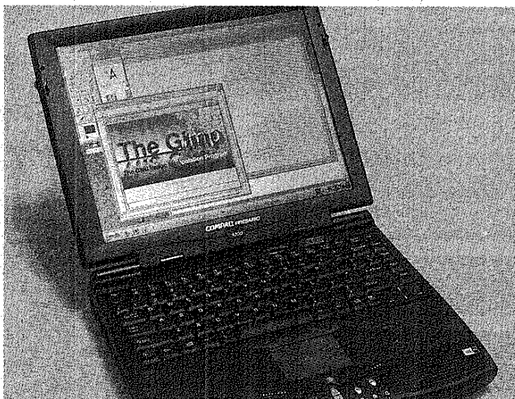
CON UNA NOTEBOOK O UN CELULAR SE PUEDE CONECTAR AL SISTEMA CONVENCIONAL

En caso que el vecino no encuentra una señal con alto nivel se le recomienda moverse dentro de esta zona hacia un lugar donde esta señal sea mayor, tal como lo muestra en su pantalla la notebook o el teléfono celular.