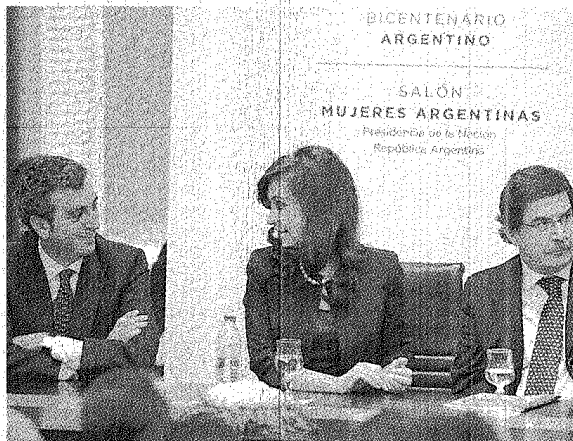
LA PRESIDENTA AL ENCABEZAR EN LA CASA ROSADA EL ACTO DE PRESENTACIÓN.