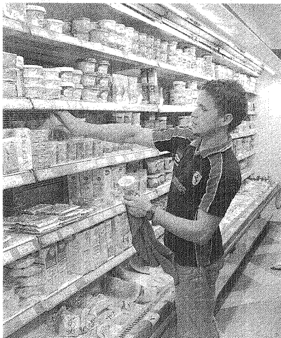
CON RESPECTO A ENERO DE 2010, LA CANASTA MOSTRÓ UNA SUBA DEL 33 POR CIENTO.

A su vez, el valor de la Canasta Básica Alimentaria por adulto -que determina la línea de indigencia- para la Ciudad de Buenos Aires alcanzó en el mes de enero a 369,4 pesos, por lo que para una familia tipo alcanza los 1141,5 pesos. #