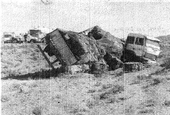
El camión Fiat Turbo sufrió rotura de su dirección y tras salirse de la ruta, se detuvo en un sector de tierra blanda.

Una docente jubilada de esta ciudad murió trágicamente ayer cuando el auto que conducía por la ruta 3, proveniente de Comodoro Rivadavia, chocó frontalmente contra un camión con semirremolque que provenía de Río Gallegos y se dirigía a Bragado (Buenos Aires), transportando un cargamento de chatarra.