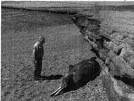
El delfín, de algo más de cinco metros, apareció junto a una enorme roca, en la playa ubicada en el acceso norte a Caleta Olivia.

Aún no está fehacientemente determinado el tipo de especie del ejemplar que llegó para morir en el balneario denominado Las Roquitas, aunque en principio se presupone que era muy viejo o sufría alguna enfermedad, dado que a simple vista no presenta ningún tipo de heridas ni tampoco