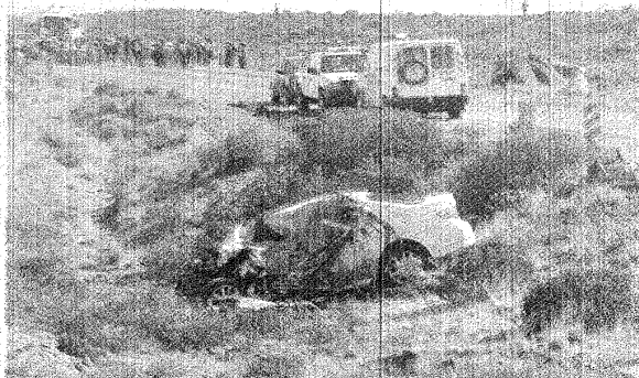
El Toyota Corolla que conducía la docente que retornaba a Caleta Olivia quedó seriamente destruido.