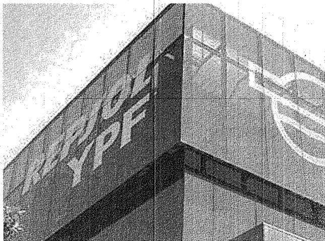
EX TRABAJADORES DE YPF SIGUEN RECLAMANDO SUS DERECHOS COMO ACCIONISTAS.

La demanda se encuadra dentro del reclamo que la Federación viene realizando en representación de sus 25.000 ex trabajadores accionistas de YPF S.A. que fueron excluidos, y por tal motivo efectuaron en diciembre pasado una denuncia ante la SEC contra