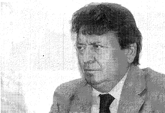
impacto y cuántas empresas hacían uso del beneficio en toda

“El año pasado hicimos la evaluación de cómo era el