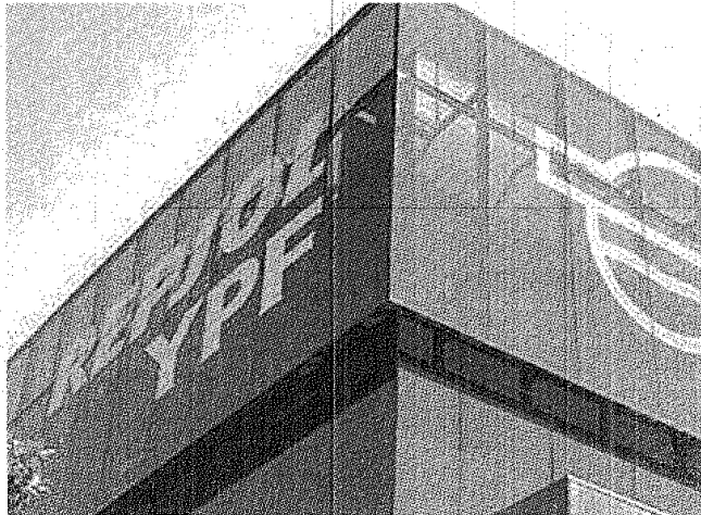
EX TRABAJADORES DE YPF SIGUEN RECLAMANDO SUS DERECHOS COMO ACCIONISTAS.

La demanda se encuadra dentro del reclamo que la Federación viene realizando en representación de sus 25.000 ex trabajadores accionistas de YPF S.A. que fueron excluidos, y por tal motivo efectuaron en diciembre pasado una denuncia ante la SEC contra