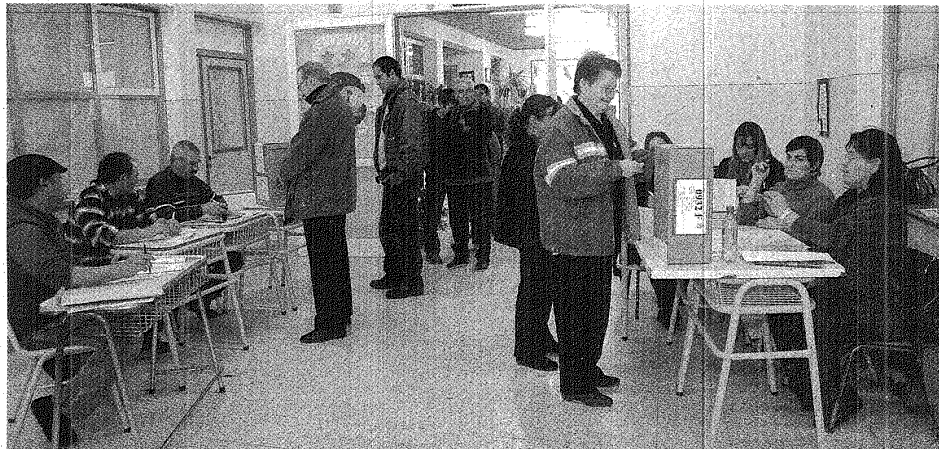
A LAS URNAS. EL 3 DE ABRIL SERÁ EL TURNO DE UNA SEGUIDILLA DE ELECCIONES INTERNAS INÉDITA EN NUESTRO PAÍS, PARA UNGIR A UN CANDIDATO PRESIDENCIAL.

Al estilo de un Colegio Electoral, se elegirá una cifra de delegados que será el doble de los legisladores nacionales que posee cada provincia. Das Neves, Duhalde y Rodríguez Saá aportarán 250 fiscales cada uno. Será una interna por semana.