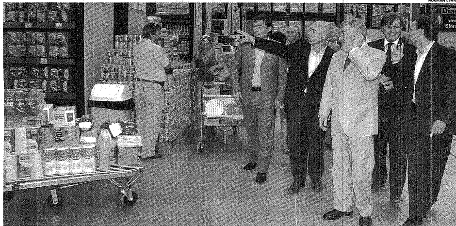
ES POR ALLÁ. UN DIRECTIVO DE DIARCO LE EXPLICA A LOS FUNCIONARIOS CÓMO ESTÁN ORGANIZADAS LAS GÓNDOLAS EN LA NUEVA SUCURSAL EN TRELEW.