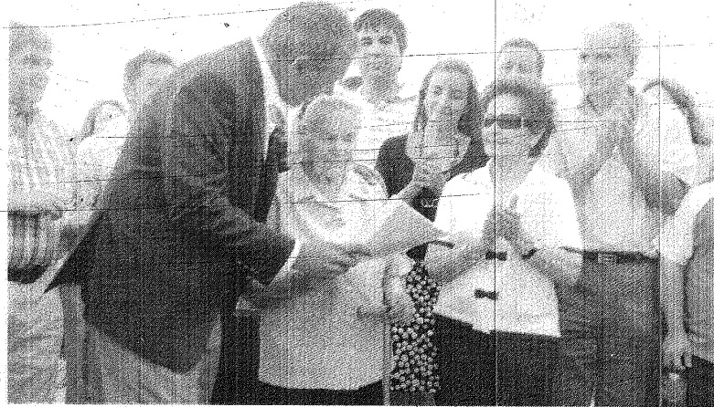
Más de 50 personas participaron del acto aniversario del barrio Presidente Ortíz donde se entregaron 50 resoluciones de tierras.