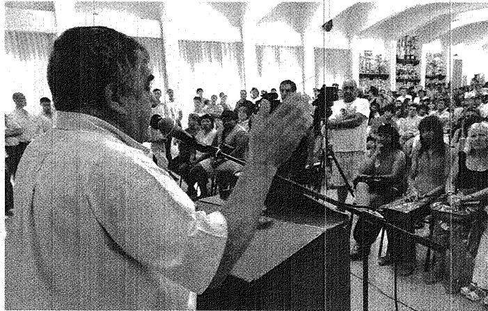
DURO. DESDE MADRYN, EL GOBERNADOR SE ADELANTÓ A LO QUE PODRÍA SER UN FALLO MUY POLÉMICO DEL SUPERIOR.

Los integrantes de la Mesa de Conducción del Partido Justicialista del Chubut enfatizaron que tras cumplir con la totalidad de los pasos legales,