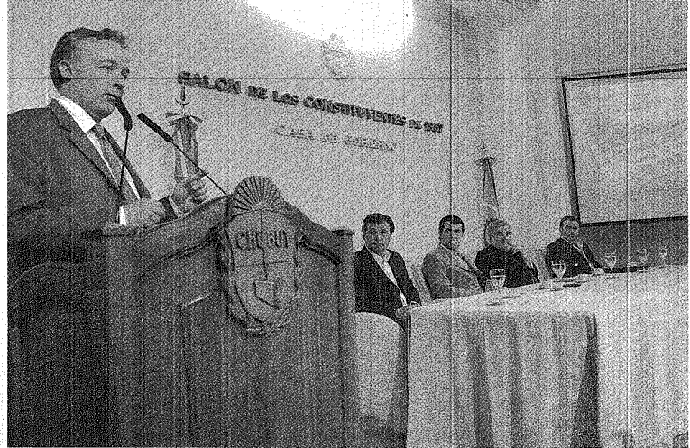
SE RESALTÓ QUE EL 60% DE LA INVERSIÓN HABITACIONAL FUE EFECTUADA EXCLUSIVAMENTE CON FONDOS PROVINCIALES.

"Tenemos una metodología de administrar los fondos del Estado de una forma distinta; por eso tenemos una diferencia con algunos sectores que están obviamente con mucho resentimiento: porque le va mal en la calle, porque lo único que hacen es