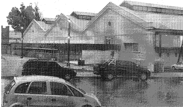
La ciudad tendrá, 110 años después de su fundación, un Centro Cultural. Será inaugurado esta tarde por el intendente y el gobernador.