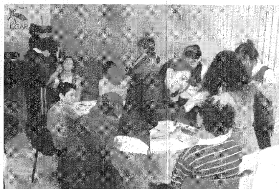
Las actividades vinculadas al teatro, música, canto y danza, entre otras especialidades culturales, tendrán continuidad en 2011.

planificados a nivel individual, pero con el objetivo claro de lograr productos que puedan integrarse e interactuar entre todos ellos a la hora de concretar una producción. La intención de este año es la de seguir creciendo y encarar desafíos más grandes que los de 2010, ya que las expectativas y continuidad de los chicos que intervienen en los talleres crece proporcionalmente. Ojalá este fin de año todos los talleres puedan lucirse como lo hicieron a fin del año pasado con la comedia musical "Costumbres de Cambio", expresó Pinelli.