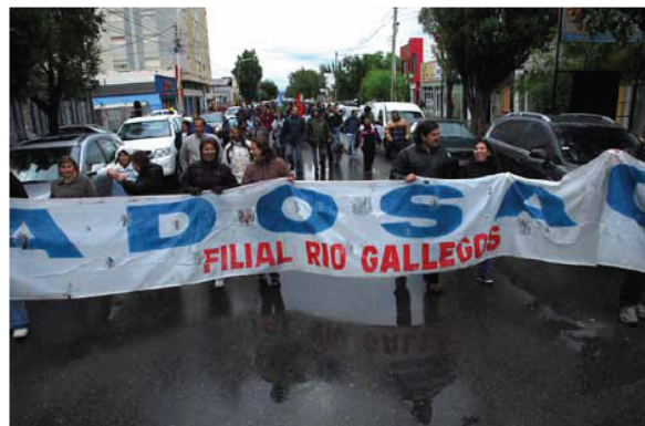
La filial local marchó ayer por las calles de Río Gallegos.

“Y la información que trajo el Gobierno a la mesa paritaria fue cero, entonces no queda ningún tipo de margen de negocia-