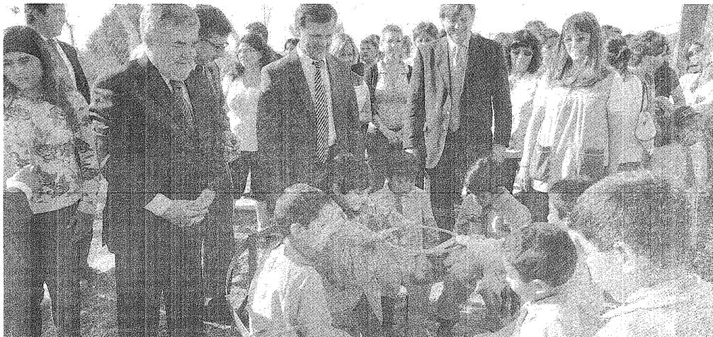
JUGUETONES. LOS FUNCIONARIOS RECUERDAN OTROS TIEMPOS MIENTRAS OBSERVAN EL ENTRETENIMIENTO DE LOS MÁS PEQUEÑOS EN UN NUEVO JARDÍN DE TRELEW.

Por la mañana, Das Neves había minimizado el impacto del paro en