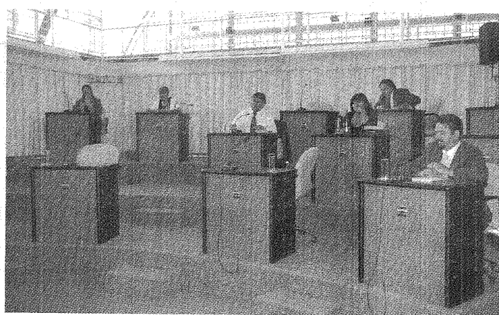
En sus bancas ayer se sentaron sólo cuatro concejales del Peronismo Federal y dos del PROVECh.

Las primeras votaciones del viernes, en las que de definía la presidencia de bloque, arrojó 5