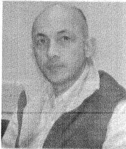
El intendente Cotillo valoró los discursos que pronunciaron Cristina Fernández y Daniel Peralta en la apertura de sesiones legislativas.

El intendente evaluó que "son muchos los objetivos que se cumplieron desde 2003 a la fecha y sin dudas quedan muchos más