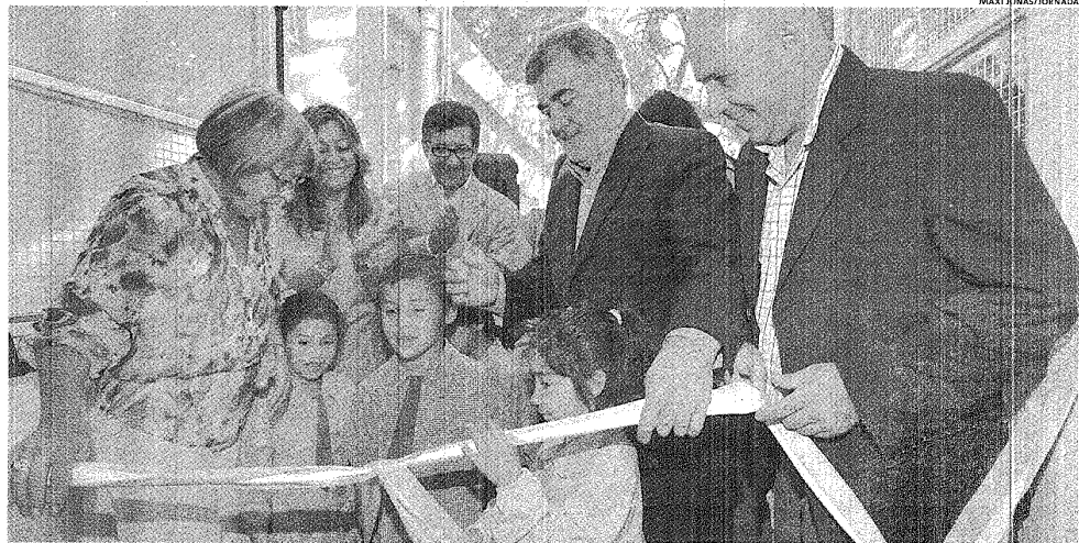
LOS ÚNICOS PRIVILEGIADOS. FUNCIONARIOS Y CANDIDATOS COMPARTEN EL ESPERADO CORTE DE CINTAS DE UN NUEVO JARDÍN DE INFANTES PARA PUERTO MADRYN.

El gobierno anunció una fiesta cultural de "magnitud nacional" para habilitar ese esperado edificio. Ayer hubo otra seguidilla de inauguraciones viales y educativas, además de contratos. El poderoso Grupo Camargo Correa, muy interesado en Chubut.