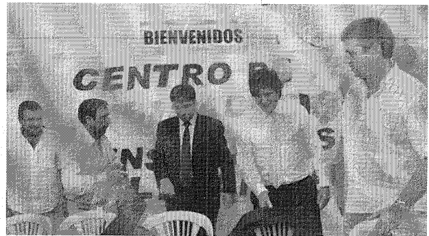
Amado Boudou admitió que vino a hacer campaña para ayudar al triunfo de Carlos Eliceche.

Por la tarde, Boudou, Bossio y Eliceche participaron de la apertura de las oficinas de la ANSES en Rawson, donde compartieron palco con el intendente local, el dasnevista Adrián López, quien sufrió las bromas de ocasión por ser el único opositor en el acto. Mientras, al cierre de esta edición ambos funcionarios nacionales participaban de la apertura de la Olimpiadas de la Tercera Edad en Puerto Madryn.