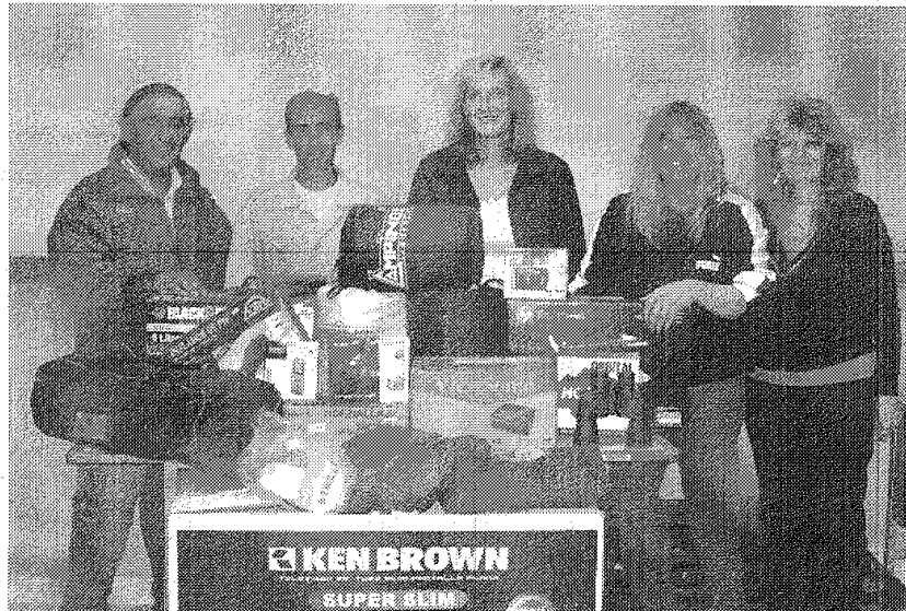
Las donaciones de la empresa procuran mejorar la calidad educativa en Chubut.

En el marco de un programa de Desarrollo Social y en coincidencia con el inicio del ciclo lectivo 2011, la operadora Tecpetrol realiza la entrega de donaciones a diversas instituciones educativas de Comodoro Rivadavia. Algunos materiales están relacionadas con las actividades académicas y otras con funciones industriales. Se proyecta una segunda entrega de donaciones a otras entidades públicas.